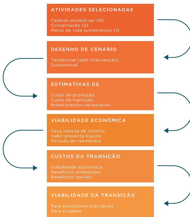
Figura 1. Passos para a construção da viabilidade econômica em Mato Grosso

42 instituições diferentes para escolher as atividades que seriam analisadas e desenhar um cenário de transição para o Mato Grosso, envolvendo os eixos de produção, conservação e meios de vida sustentáveis. Os cenários de transição foram construídos não a partir de uma projeção de demanda de mercado, mas sim a partir de uma visão dos atores de cada setor envolvido sobre o futuro de cada atividade, seus gargalos e como elas poderiam melhorar usando critérios de sustentabilidade (econômico, social e ambiental).