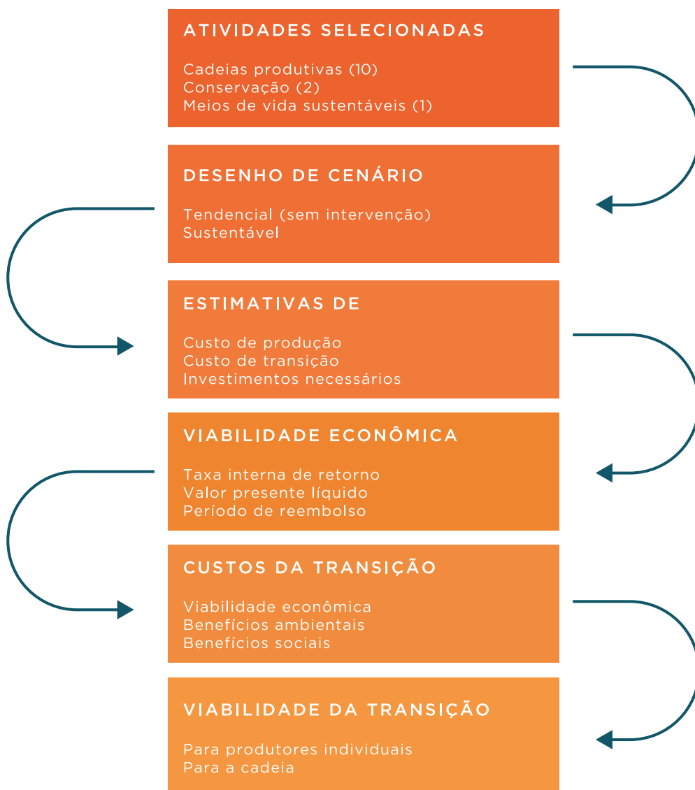
Figura 2. Passos para a construção da viabilidade econômica em Mato Grosso